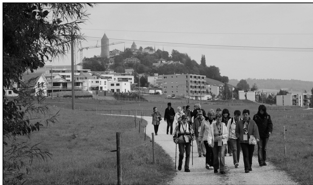
Entre ami(e)s ou en famille, la Balade gourmande permet de se promener et de découvrir des chemins ou des paysages tout en dégustant un bon repas

Avec la baisse de participation et un équilibre financier incertain, la Jeune Chambre Internationale de la Glâne se pose la question de la pérennité de la manifestation. Une première solution envisagerait son organisation en alternance avec les 20 Heures de musiques; quant à savoir si la prochaine édition aura lieu en 2011 ou en 2013, la question reste ouverte, les comités d'organisation et de la JCI Glâne devant en discuter.