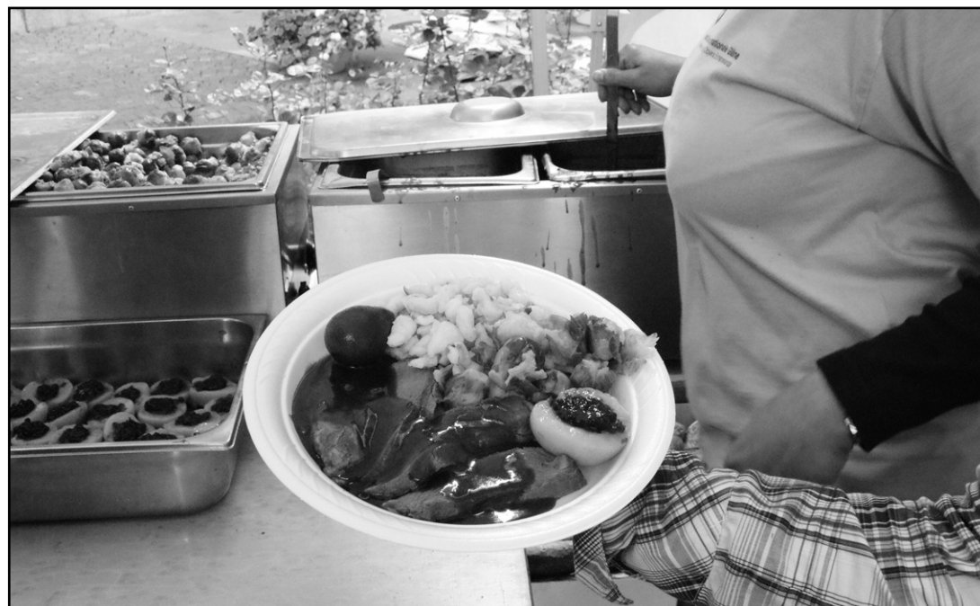
Une belle assiette de gibier et sa garniture